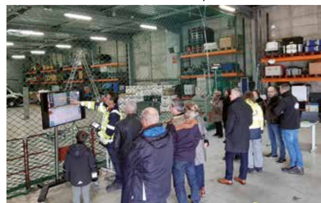
Démonstration, vol de Drones en intérieur