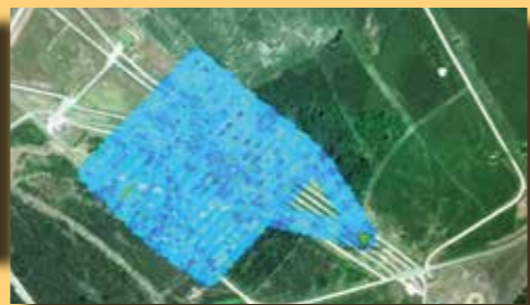
Cartographie radiologique de 10ha effectuée en 25 minutes (Evaluation de la contamination surfacique réalisée à proximité du point de décollage).