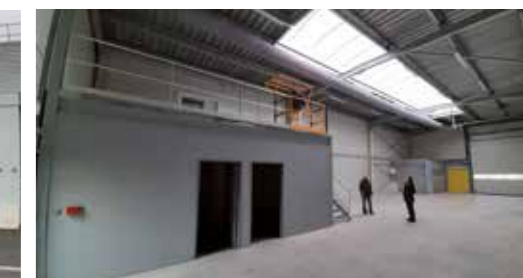
Trois alvéoles pour entreposer les modules d'intervention