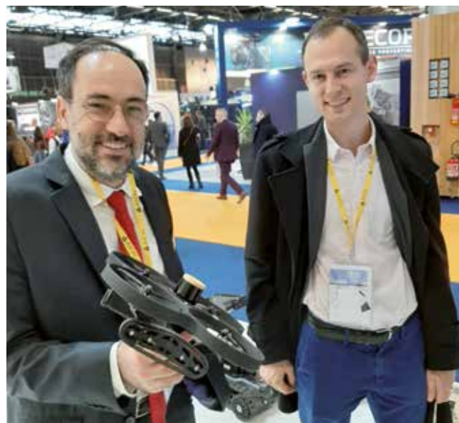
2 en 1 : Robot et drone de NERTER Robotics